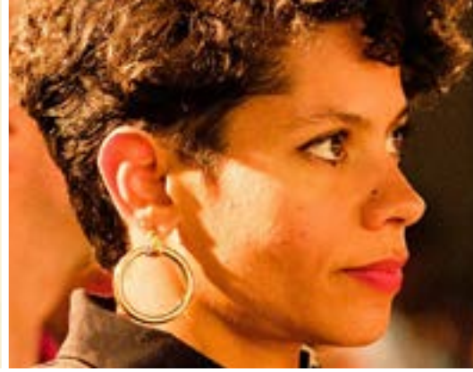
Foto links: "Audre Lorde" © Elsa Dorfman creator QS:P170,Q5367400 ( https://commons.wikimedia.org/wiki/File:Audre_lorde.jpg ), https://creativecommons.org/licenses/by-sa/3.0/legalcode

Foto rechts: "Emilia Roig" Polimorph ( https://commons.wikimedia.org/wiki/File:Emilia_Roig_40901170673_cropped.jpg ), https://creativecommons.org/licenses/by-sa/4.0/legalcode