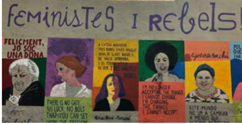
Foto rechts: La Rambla, Barcelona, Spanien (2020)