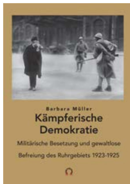
Kämpferische Demokratie (2025) – Barbara Müller“ Buchtitel von Irene Publishing, https:// irenepublishing.com/ product/kampferische- demokratie/